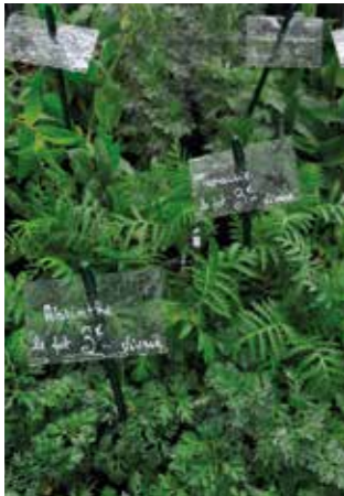
Marché aux fleurs 1 er mai