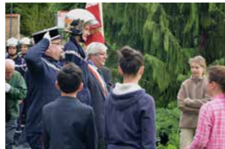
Commémoration du 8 mai 8 mai

M. le Maire et le Conseil municipal sont heureux d'inviter les jeunes citoyens désidériens à venir retirer leur carte d'électeur lors d'une cérémonie organisée en leur honneur en mairie - salle du Conseil, le samedi 6 juin à 11h . Renseignement et inscription - 04 78 35 85 25.