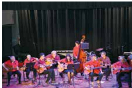
Jazz Day 30 avril