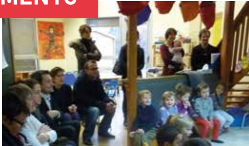
Mercredi 4 février - semaine de la maternelle Les parents d'élèves assistent pendant une heure à la classe.