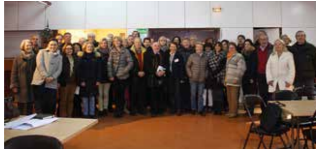
Mercredi 4 février Réunion de l'ensemble des référents et assistants de quartier.