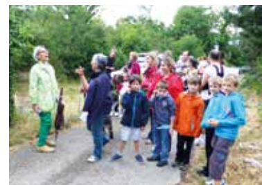
Soirée cabornes 28 juin