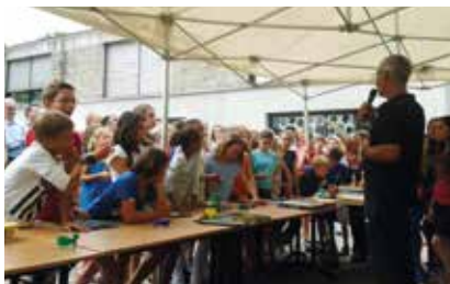
Traditionnelle remise des livres aux enfants de CM2 1 er juillet

Mardi 1 er juillet , fête de fin d'année organisée à la Lyre. Les différentes structures petite enfance de la commune étaient regroupées : la crèche la Lyre, la crèche et le jardin d'enfants de la Doriane ainsi que les assistantes maternelles du RAM (Relais d'assistant(e)s maternel(le)s). Les animaux de la « Ferme TILIGOLO » s'étaient invités pour le plus grand plaisir des petits et des grands, de nombreux parents étant venus participer à la fête. Après la traite de la chèvre et les biberons donnés aux bébés animaux, les enfants et adultes ont pu caresser, jouer avec les canetons, les poules, le cochon et les lapins. « Un bon retour en enfance pour tous ! »