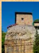
Visites commentées des carrières de St Fortunat le dimanche 21 septembre à partir de 14h30