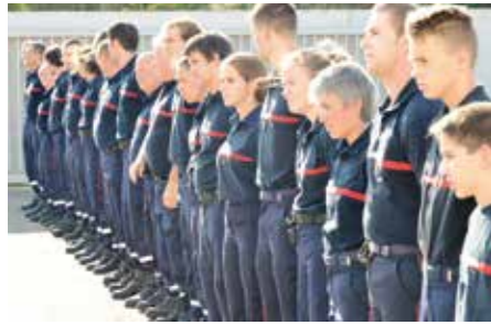
Fête Nationale du 14 juillet Cérémonie à la Caserne de St Cyr/ St Didier