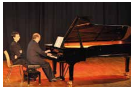
Récital Alain Planès 19 novembre