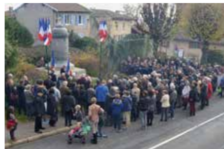
Commémoration du 11 novembre 1918 11 novembre