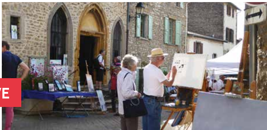
La Journée peinture et sculpture du 11 septembre organisée par Vivre Saint Fortunat. Bon succès avec 1 500 visiteurs pour cette 14 e édition