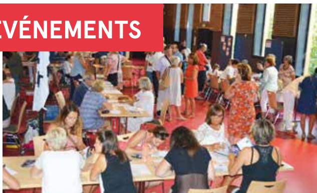
Forum des associations ■ 3 septembre