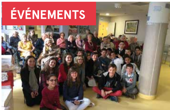
Spectacle CME à l'EPHAD - 11 mars