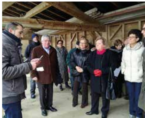
20/01 - Inauguration du Parcours d'Orientation de Giverdy