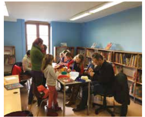
13/01- Les RDV de la bibliothèque