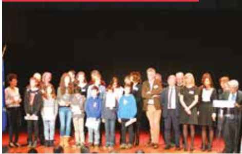
11/01 - Vœux du Maire