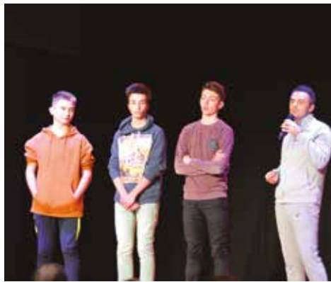
11/01 – Vœux du Maire Sportifs méritants