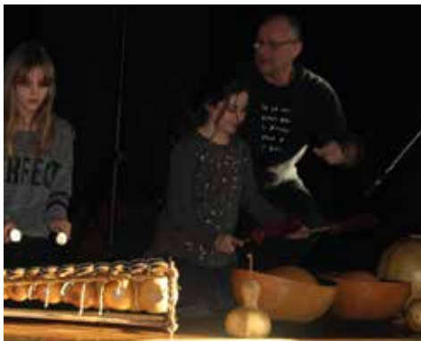
13/01 – Conté chanté de la FCPE