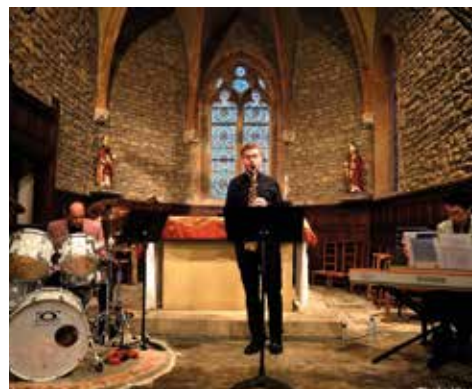
24/03 - Concert des professeurs de l'Ecole de Musique