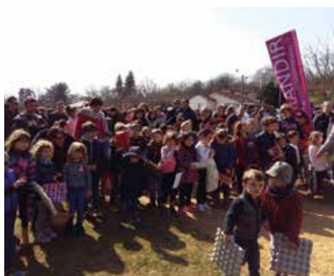
25/03 - Chasse aux œufs géante Une fois de plus ce fut un beau succès