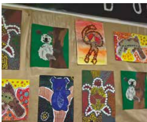
06/04 - expo et portes ouvertes de l'école maternelle du Bourg