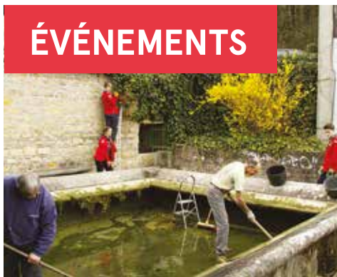
24/03 - Journée communale pour l'environnement - Nettoyage de printemps pour le lavoir et son environnement