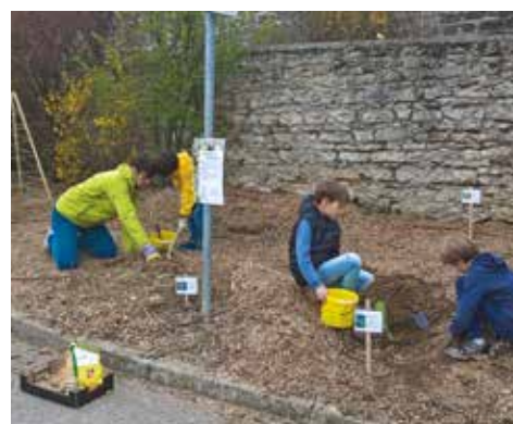
07/04 - « Jardinons ensemble »