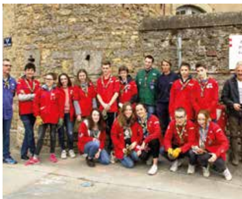
24/03 - Journée communale pour l'environnement - Un grand merci aux scouts qui sont venus prêter main forte aux bénévoles