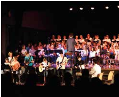
02/06 - Concert de Midosi : les Misérables