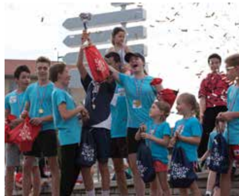
09/06 - Fête du sport