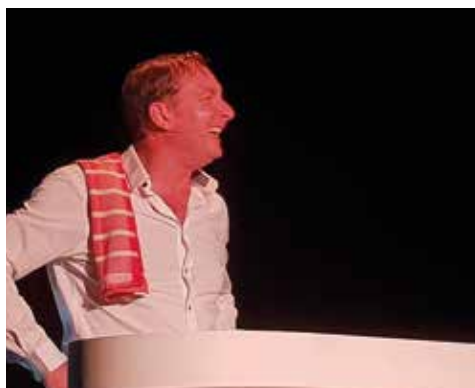
14/06 - Nuits de Saint Didier – Soirée Humour