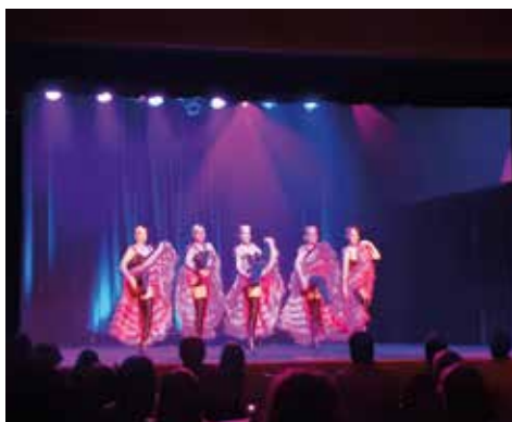
15/06 - Nuits de Saint Didier – Soirée Cabaret