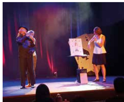
16/06 - Nuits de Saint Didier – Soirée Cirque