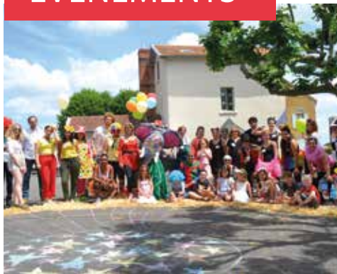
02/06 - Fête de la Marelle